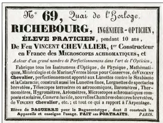
Carte commerciale de Richebourg, 1842 (8,7 x 11,2 cm).