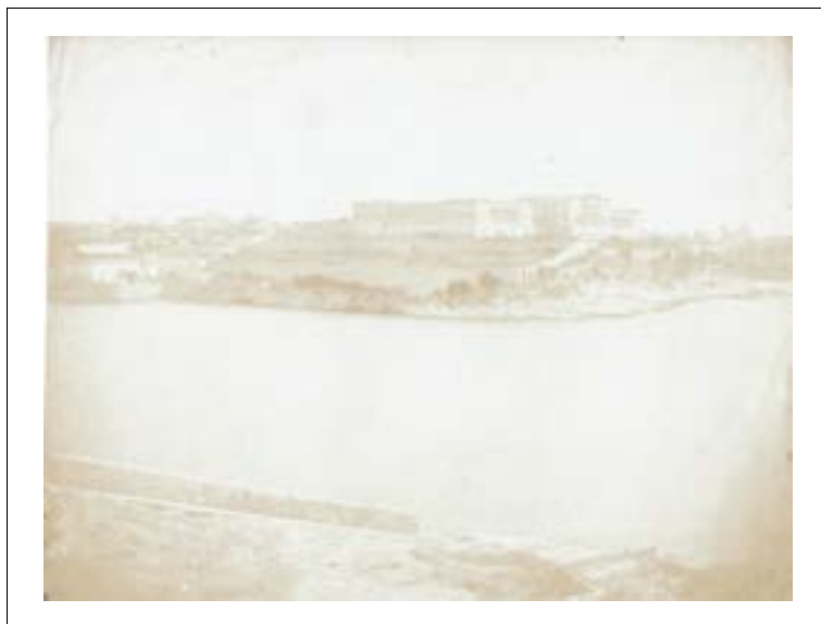
Royal Navy Hospital Bigli, Kalkara, Malta. 1846. Épreuve sur papier salé d'après un négatif papier. 15,7 x 20,6 cm.