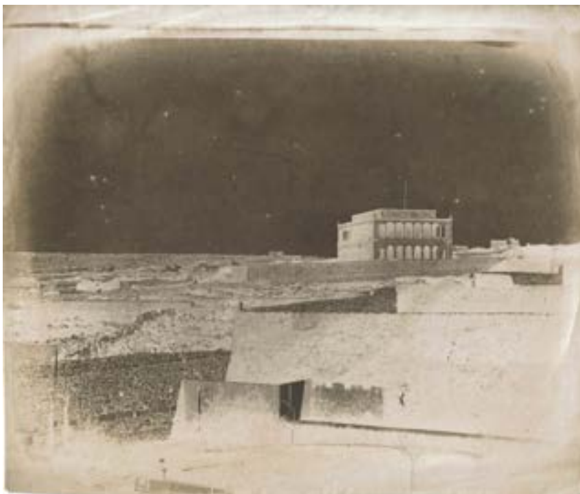
Fortifications of Malta. 1846. Négatif papier. 18,2 x 21,6 cm.