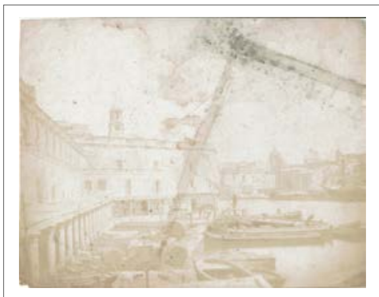
Dock yard Malta. 1851. Épreuve sur papier salé d'après un négatif papier. Mention du titre à l'encre au dos. 17 x 21,7 cm.