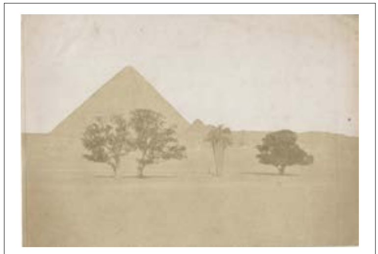
Pyramide de Khéops, Gizeh. 1851. Épreuve sur papier salé d'après un négatif papier. 14,7 x 21,4 cm. Une vue similaire et de même format a été réalisée par Maxime Ducamp en 1849.