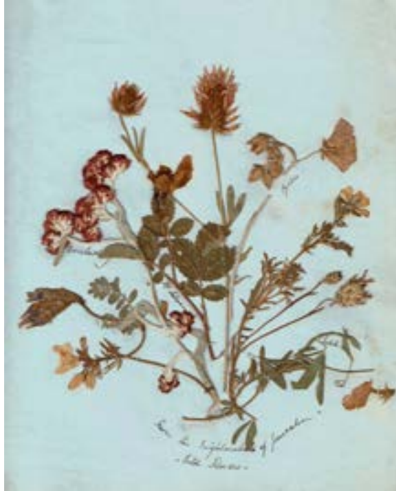
Planche 1 20,7 x 17,6 cm.