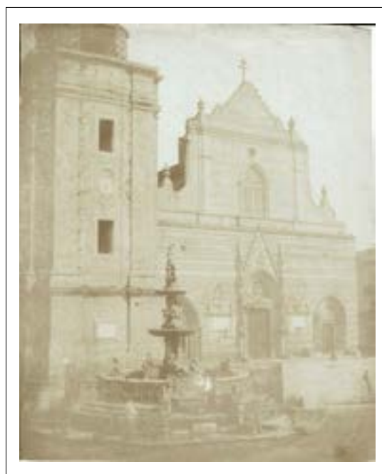
Chiesa Annuziata, Messina, Sicile. 1846. Épreuve sur papier salé d'après un négatif papier. 21 x 17 cm.