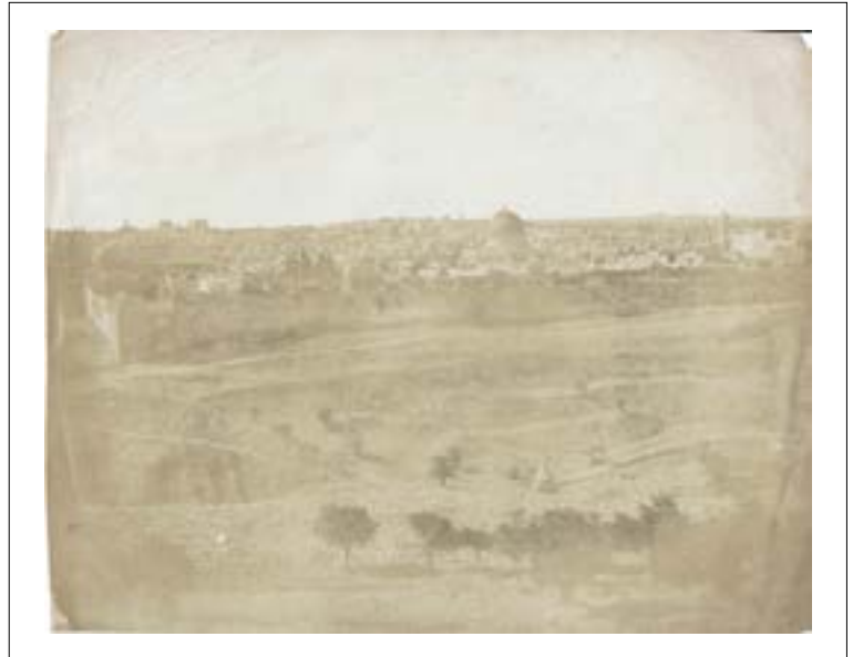
Vue générale de Jerusalem. 1850. Épreuve sur papier salé d'après un négatif papier. 17 x 21,5 cm.