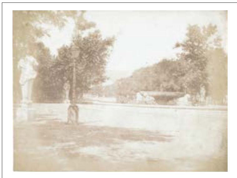
Jardin aux sculptures et bassin aux lions, Paris. 1846.

Épreuve sur papier salé d'après un négatif papier. 15,8 x 20,9 cm.