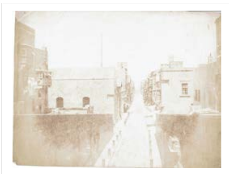
Strada Reale, La Valette, 1851. Épreuve sur papier salé d'après un négatif papier. 16,4 x 20,7 cm.