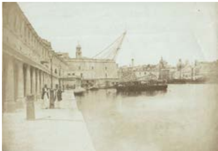
Dock yard Malta. 1851.

Épreuve sur papier salé d'après un négatif papier. 15 x 21,6 cm.