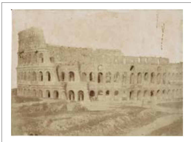
Rome: Coliseum. 1846. Épreuve sur papier salé d'après un négatif papier. 14,2 x 20,3 cm.