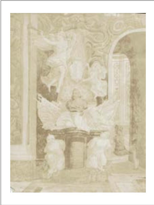
St John co-cathedral, gem of baroque art. Shrine to the knights of Malta, 1846.

Épreuve sur papier salé d'après un négatif papier.