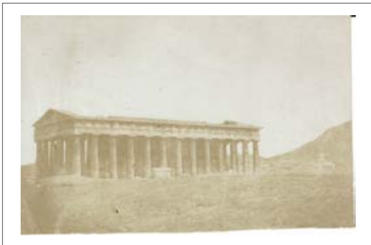
Temple of Concordia, Agrigento, Sicile. 1846-1847

Épreuve sur papier salé d'après un négatif papier. Filigrane (Watermark) «JOYSONS 1846». 18,5 x 20,6 cm.