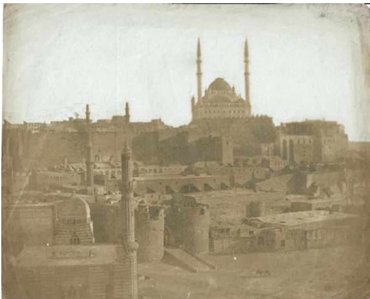
Al-Azhar mosque, Le Caire, vue générale. 1851. Épreuve sur papier salé d'après un négatif papier. 18,7 x 23,3 cm. Partie du filigrane (watermark) : « JO » de la marque JOYNSON.