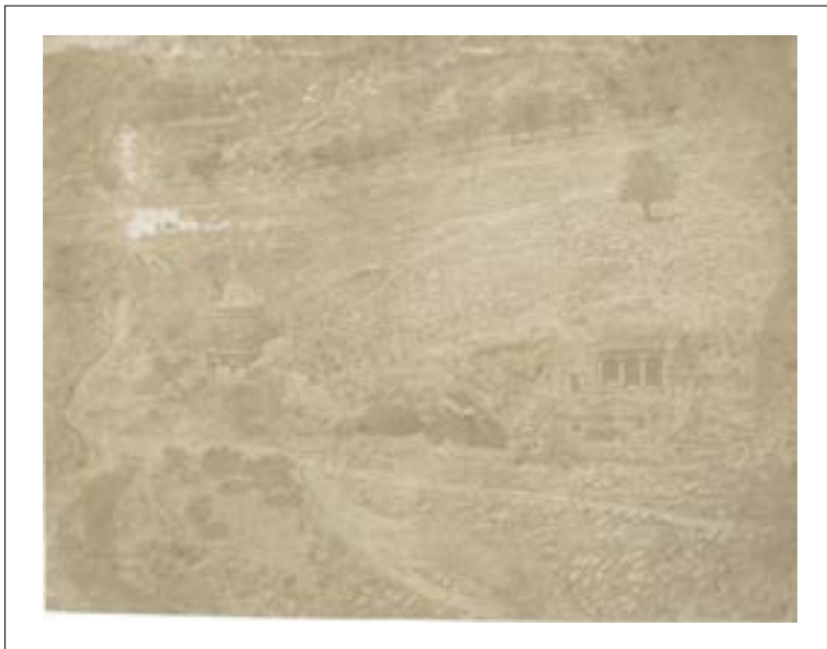
Absalom's monument and Benei Hezir's tomb. Valley of Kidron, Jerusalem. 1850. Épreuve sur papier salé d'après un négatif papier. Mention à la mine de plomb au dos : "Below these sepultures between the brook or bed of Kidron is an extension of more modern Jewish grave stones called the house of the living". "The tomb of Ab- salom and St. James". 15,2 x 19,6 cm.