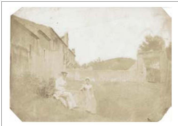
Convent of St Nicola, Catania, Sicile. 1846. Épreuve sur papier salé d'après un négatif papier. Quatre angles coupés. Mention manuscrite à l'encre au dos : Convent of Nicolo... 15,5 x 21,7 cm.