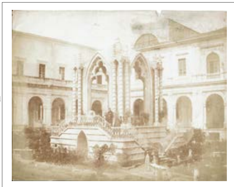
Garden of the Benedictine Monastery of San Nicolo l'Arena, Catania, Sicile. 1846. Épreuve sur papier salé d'après un négatif papier. 17 x 21,5 cm. Des variantes de cette vue sont conservées au National Media Museum de Bradford.