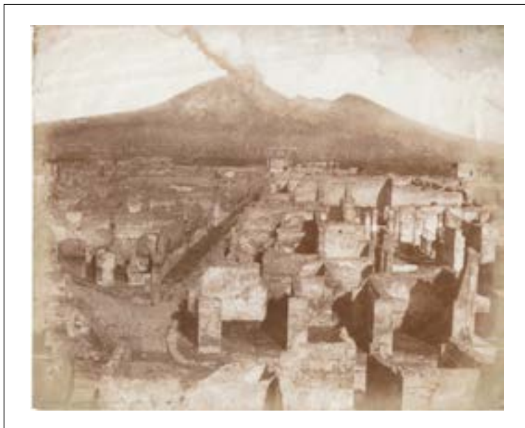
Naples. View of the town from South. 1846-1847 Épreuve sur papier salé d'après un négatif papier. Mention du titre à l'encre au dos. 17 x 20,8 cm.