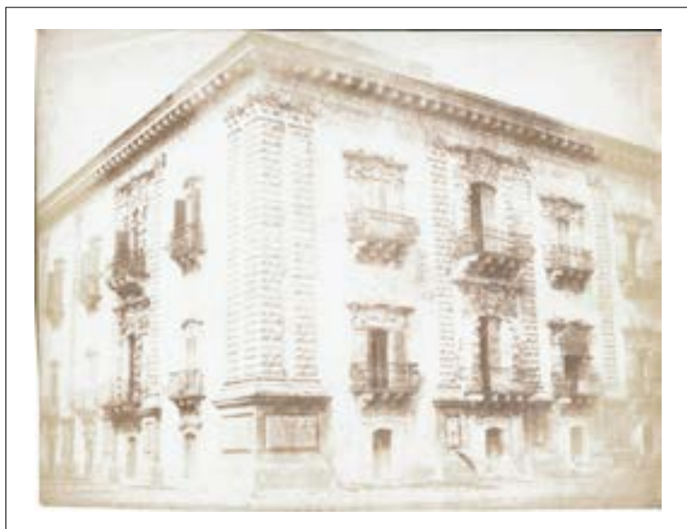
Benedictine Monastery of San Nicolo l'Arena, Catania, Sicile 1846. Épreuve sur papier salé d'après un négatif papier. 16,6 x 21,8 cm.