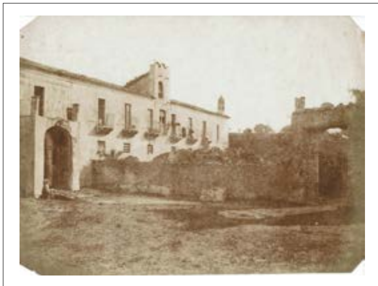
Convent of St Nicolo, Catania, Sicile. 1846. Épreuve sur papier salé d'après un négatif papier. Quatre angles coupés. Mention manuscrite (illisible) à la mine de plomb au dos. 16 x 21,3 cm.