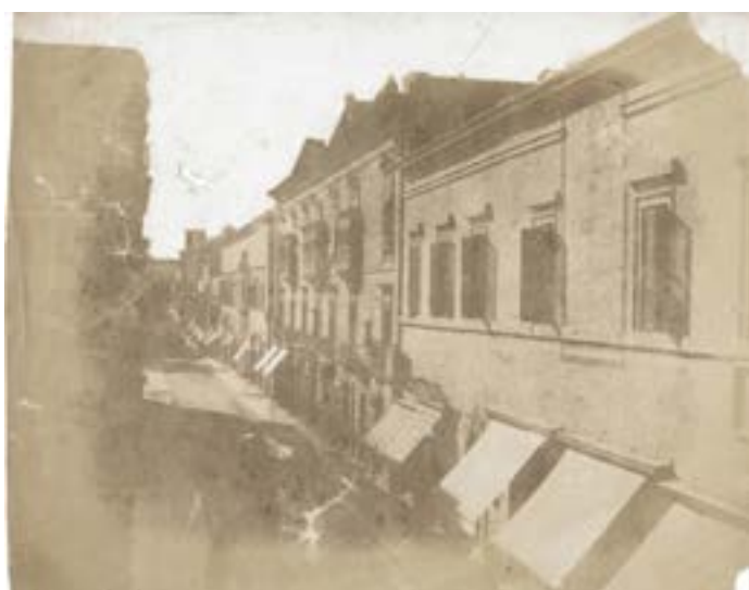
Strada Reale, Malta. 1851.

Épreuve sur papier salé d'après un négatif papier. 13,7 x 20,5 cm.