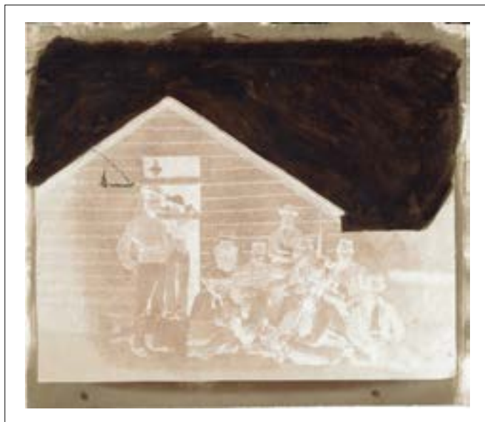
Soldats au repos devant un baraquement. Contretype vers 1846-1852. Négatif papier d'époque au ciel masqué à l'encre noire et brune. 16,7 x 19,3 cm.