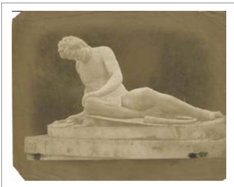
Rome, capitol. The dying gladiator. 1846. Épreuve sur papier salé d'après un négatif papier. Quatre angles coupés. 16,2 x 21,2 cm.