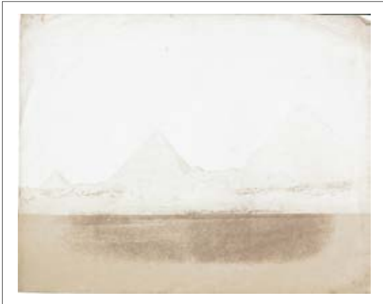
Pyramides de Gizeh. 1851. Épreuve sur papier salé d'après un négatif papier. 17,1 x 21,6 cm.