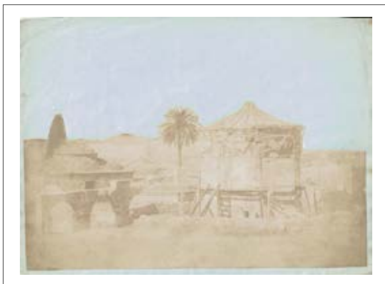
Athens, roman agora, the Fethiye mosque and the tower of the winds. 1848.

Épreuve sur papier salé d'après un négatif papier, découpée et collée sur papier bleuté. Format du montage : 16,3 x 22,2 cm.