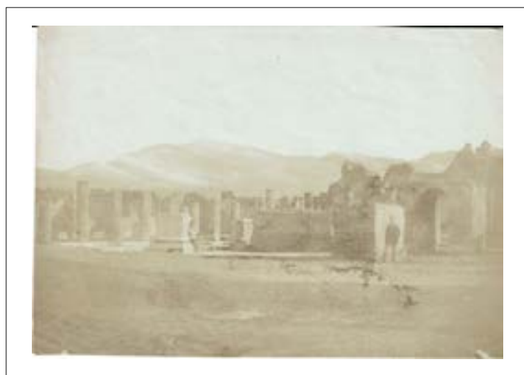
Forum of Pompeii. 1846-1847.

Épreuve sur papier salé d'après un négatif papier. Filigrane (Watermark) «JOYSONS 1846». 18,5 x 20,6 cm.