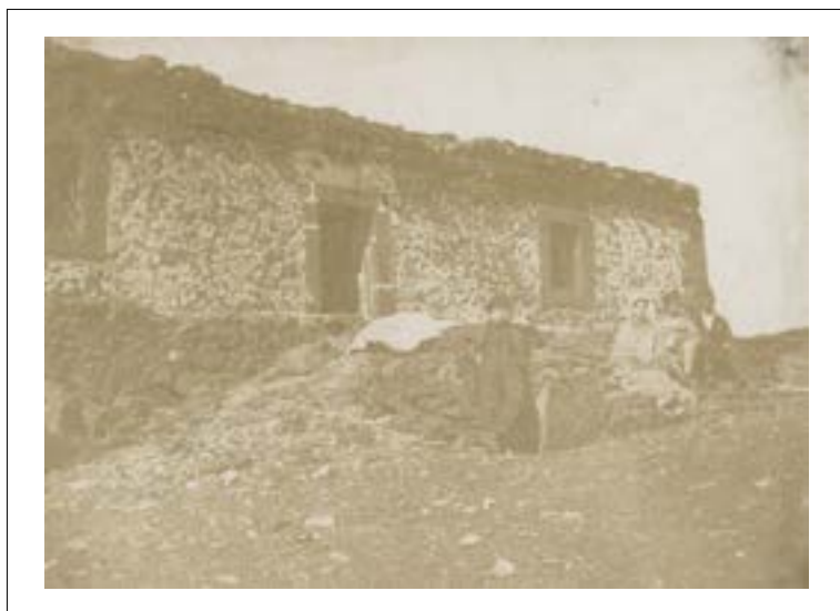
Casa inglese, Mount Etna. Sicile. 7 au 12 septembre 1846. Épreuve sur papier salé d'après un négatif papier. Traces de points de colle aux quatre angles au dos. 15,5 x 21,3 cm.