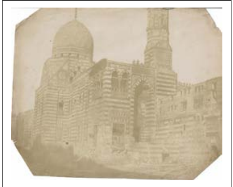
Al-Azhar mosque, Le Caire. 1851. Épreuve sur papier salé d'après un négatif papier. Quatre angles coupés. 18 x 22,2 cm.