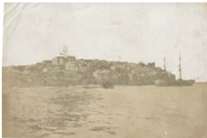
Ship in the port of Malta. 1851.

Épreuve sur papier salé d'après un négatif papier. 15 x 21,6 cm.