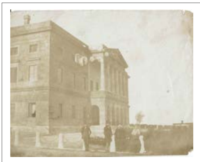
Quatre personnages en tenue de ville devant deux édifices. 1846-1852. Épreuve sur papier salé d'après un négatif papier. 16,8 x 21 cm.