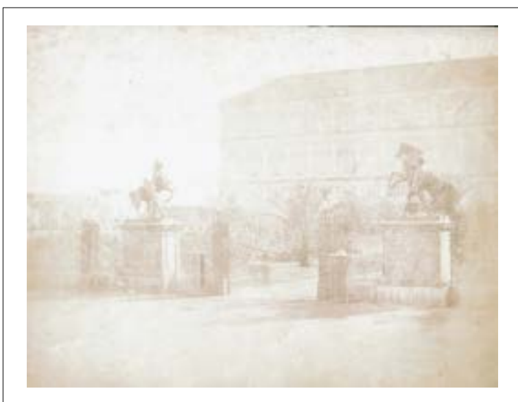
The king's palace. Naples, 1846-1847.

Épreuve papier salé d'après un négatif papier. Mention du titre à l'encre au dos. 14,3 x 21 cm.